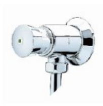
PRESTO 12 A falra kívüli öblítőszelep ref. 31707