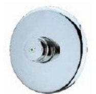
PRESTO 60 B süllyesztett vizeleöblítő ref. 15233