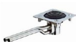
PRESTO SOL 509 aljzatba süllyeszthető, lábbal működtethető öblítőegység ref. 23100