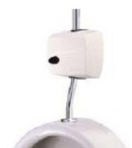
PRESTO SENSÃO 8200 Epoxy fehér felülettel, 6 V-os lítium elemmel ref. 55300 felső vízcsatlakozás ref. 55310 hátsó vízcsatlakozás