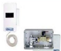
IR vezérlésű egység Komplett, elektronikusan vezérelt sorvizeledé egység 230/12 V-os transzformátorral ref. 52914 5/4" csatlakozás ref. 52915 3/4" csatlakozás